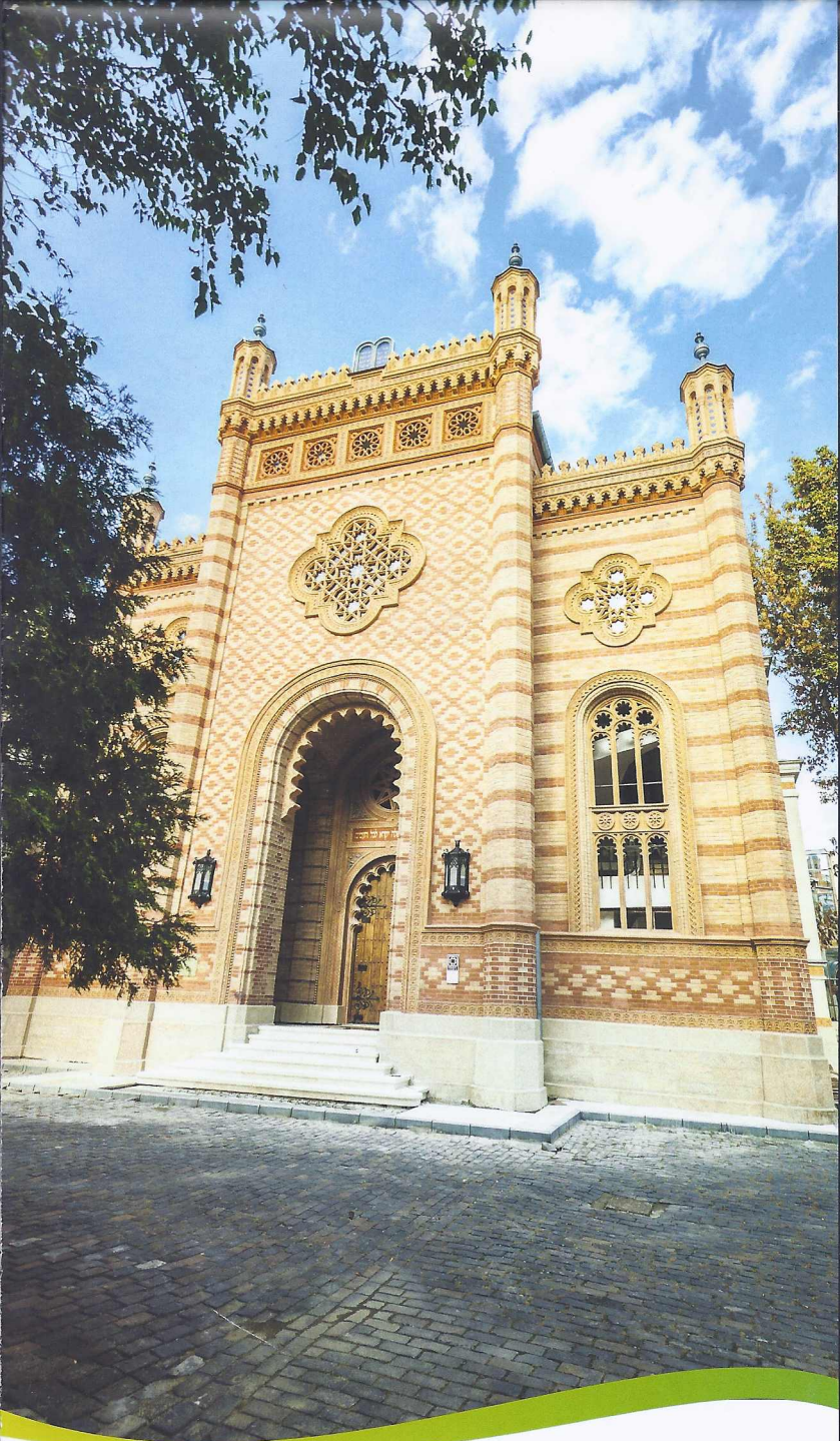
Templul Coral - București